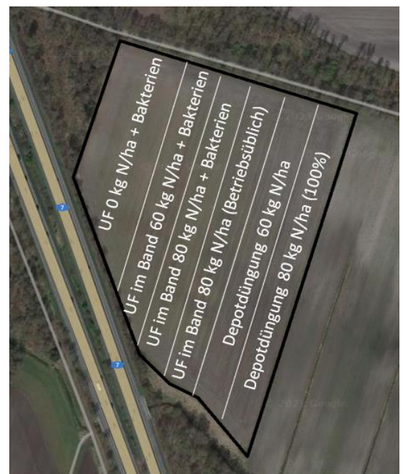
Abbildung 1: Versuchsaufbau: Darstellung der verschiedenen Düngestufen sowie Beimischung weiterer Bodenhilfsstoffen. (Vorgewende: 12 m 100 % Depotdüngung (80 kg N/ha). Ganzflächig breit verteilt 90 kg N/ha anrechenbar aus Gärrest).

Die Frühjahrs- N_{min} Beprobung ergab für den gesamten Schlag einen Wert von 32 kg N/ha. Es folgte eine breitflächige Verteilung von Gärrest von dem rund 90 kg N/ha angerechnet werden können.