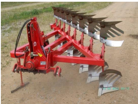
Abbildung 2: Schälpflug Ovlac-Mini